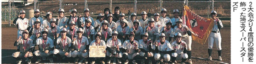
2大会ぶり4度目の優勝を飾った埼玉スーパースターズF