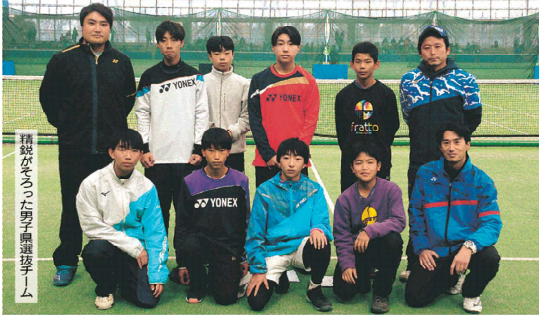
精鋭がそろった男子県選抜チーム