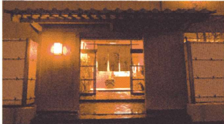
創業大正九年以来「料亭やまさ」は百年間伝承されるすっぽん専門料亭。

先祖四代に渡り、100年もの間受け継がれてきた老舗すっぽん専門店「料亭やまさ」には、昭和の文豪、松本清張氏をはじめ昔から各界の著名人も度々訪れるは舌鼓を打ち、英気を養ってきた由緒ある料亭だ。 ◆職人の手で二つ二つ取材に訪れた私は料亭の厨房を覗いてみた。すると、料理人が一匹ずつ人の手で丁寧に調理していた。甲羅と消化器官、頭爪を取り除き、肉とコラーゲンを豊富に含んだエンペラ部分を工場