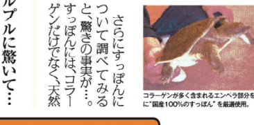
コラーゲンが多く含まれるエンペラ部分を中心に「国産100%のすっぽん」を厳選使用。