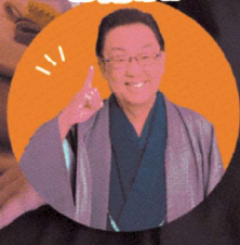
かさばる着物や帯は出張買取が便利。独自の「思いやりサポート」10分無料お手伝いサービスも好評です。