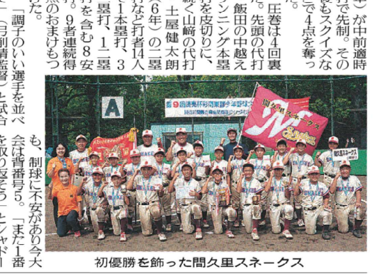
初優勝を飾った間久里スネークス

「調子のいい選手を並べ、制球に不安があり今大会は青番号5。一またし一番打を含み、二塁打を含む8安打、9者連続得点のおまけもつ 「調子のいい選手を並べ、制球に不安があり今大会は青番号5。一またし一番打を含み、二塁打を含む8安打、9者連続得点のおまけもつ