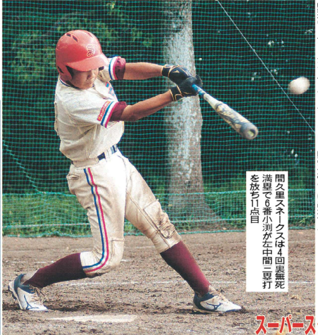
間久里スネークスは4回裏無死満塁で6番小淵が左中間一塁打を打ち1点目