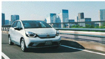
Photo:フィット e:HEV HOME (FF) 車両本体価格の一例(消費税10%込み)2,068,000円* ※価格は標準的なオプションの価格が含まれておりません。 ボディカラーはプレミアムサンライズホワイトパール(有税別:55,000円高)メーターオプション(Honda CONNECT for Gathers+ナビ装着用スペシャルパッケージ(リアウィンドウカッパ など)49,500円高)装着車。■Honda CONNECT for Gathers+ナビ装着用スペシャルパッケージを装着した場合は、「シガーフアンアンテナ」が装備されます。

2モーターハイブリッドシステム[e:HEV (イー・エイチ・イー・V)] をHondaコンパクトクラスとして初採用。